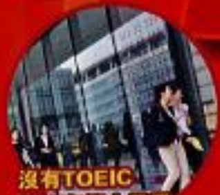
沒有TOEIC 就沒有衝上雲霄