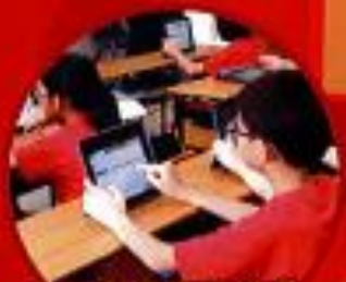
香港電子學習推手 繼續教育澳門踏正路