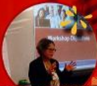
至具前瞻性的英文教學法 盡在Propell Teacher Workshop